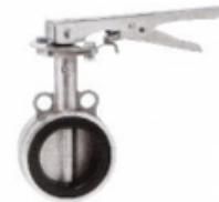
KS B 2813