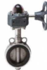
KS B 2813