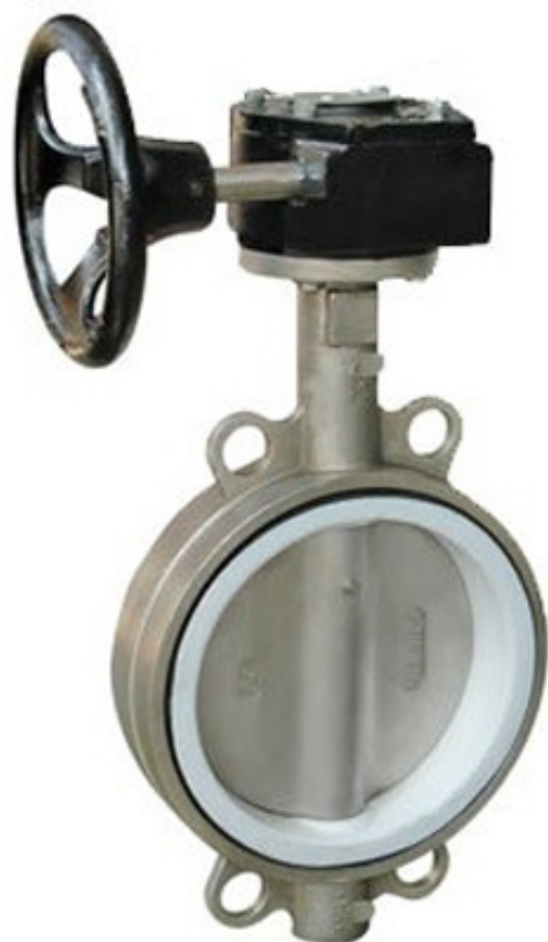
Van bướm inox PTFE tay quay