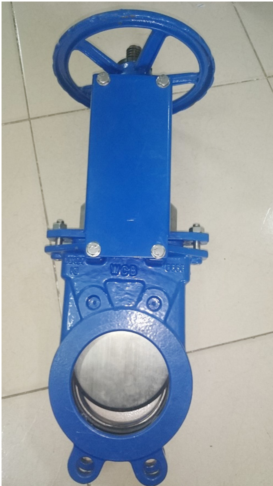
MỘT SỐ LOẠI VAN CỔNG ĐẠO TƯƠNG TỰ