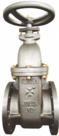
KOREA KS B 2350 KCW-2014-0187

CAST IRON 10K FLANGE GATE VALVE(NON-RISING STEM)