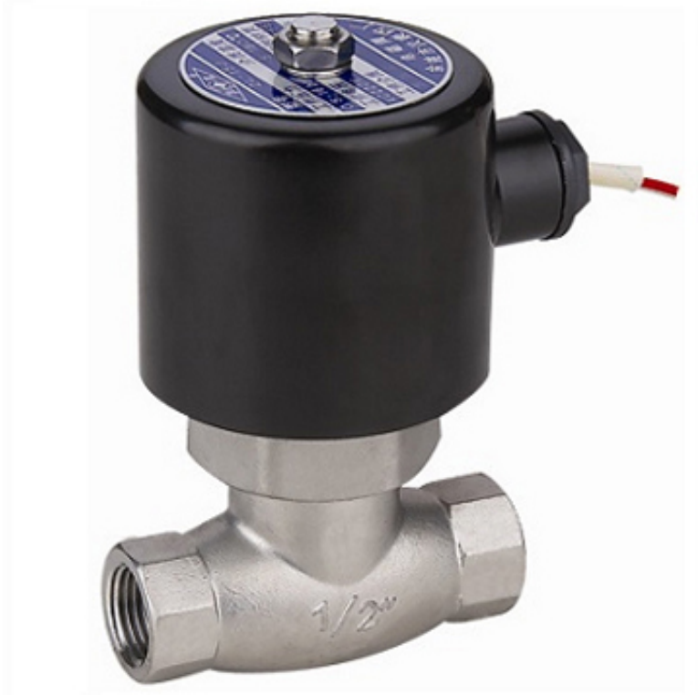
Van điện từ hơi 2L400-20J- Round-Star