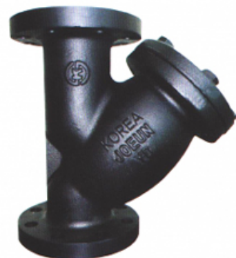
KOREA KS B 1538